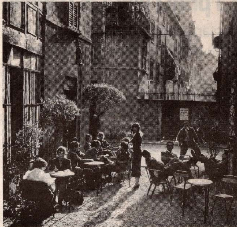
Una delle celebri immagini di Mulas sul bar Giamaica. Sotto, una foto in mostra a Grugliasco

Ancora fotografia a Villa Boriglione, la dimora settecentesca situata