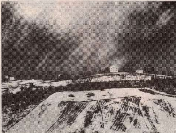
«Paesaggio. Presa di coscienza sulla natura» di Mario Giacomelli